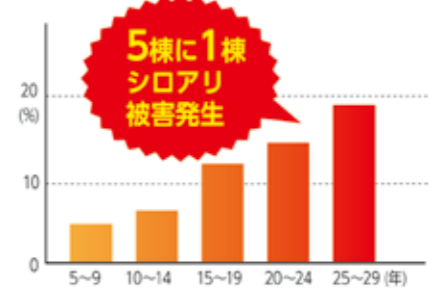
築年数ごとのシロアリ被害発生率

日本長期住宅メンテナンス有限責任事業調べ 平成24年度国土交通省補助事業全国5000戸調査